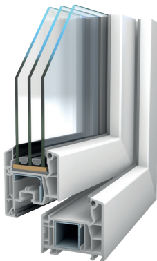
Softline 76 AD Anschlagdichtung